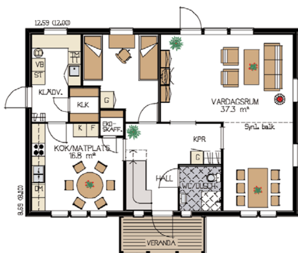
Bottenplan, boyta 97 m²